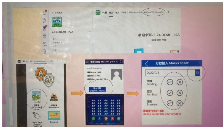
Teams-- Power App

7.) 每個學習循環完結後可以參與獎勵活動，獲得 9-12 粒能量方塊的同學均可：